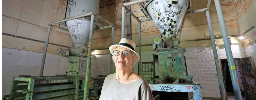
Die Galerie der Künstlerin Rotraud von der Heide auf dem Teufelsberg diente den Militärspionen früher als Schredderanlage.

Wie es mit der Ex-Abhörstation auf dem Teufelsberg weitergeht, ist unklar – das ärgert vor allem die Kulturschaffenden, die die Ruinen beleben. VON CAY DOBBERKE